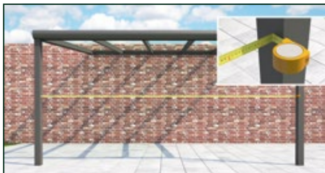
Ouverture que vous voulez fermer à l'avant de votre véranda