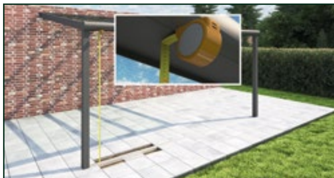
Hauteur de passage du dessus de la gouttière pour porte et baie coulissante jusqu'au-dessous (partie inférieure) plate de la gouttière.