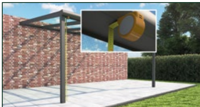
Hauteur de passage du dessus de la fondation jusqu'au-dessous (face inférieure) plat de la gouttière.

La véranda X a une hauteur libre de 2095 mm, du haut de la fondation/du pavage au-dessous plat de la gouttière/de la poutre. Vous choisissez ensuite un système de rails d'une hauteur de 2080 mm et 2120 mm.